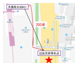
地铁口至乘车点路线图