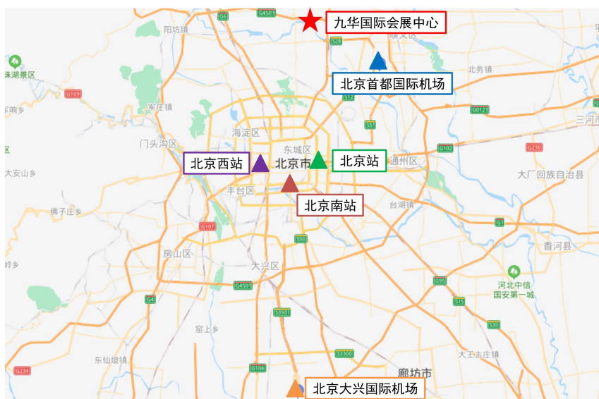
交通站点与大会会场位置图